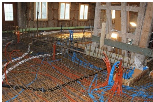
Bewehrung Decke EG