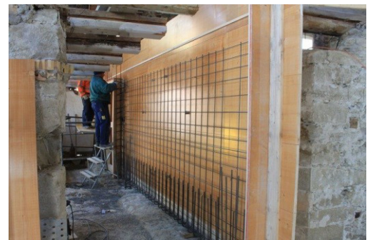
Wand als Abfangträger