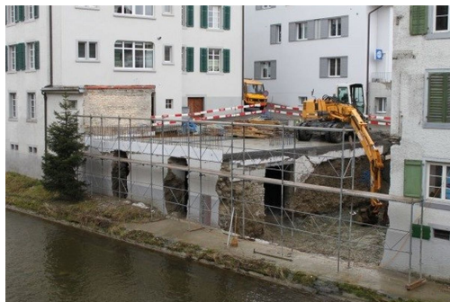
Anbau bei Gewölbekeller

Spezielles Umbau in denkmalgeschützter Liegenschaft, Bauen im Hochwasserbereich, Erdbebenertüchtigung im Bestand