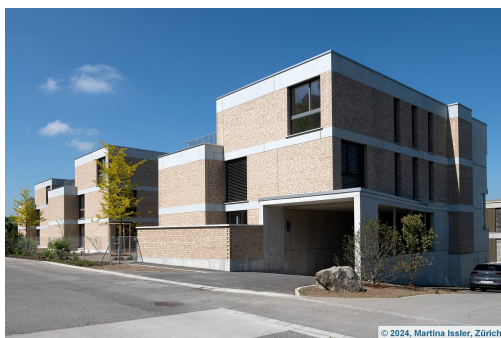
Ansicht Süd-Ost mit TG-Einfahrt

Spezielles Um einen gedeckten Hauszugang und zwei Aufenthaltsflächen zu generieren, wurde das EG mit einer grossen Auskragung erstellt. Der entsprechende Lastfluss erforderte eine Optimierung der lastabtragenden Wände.