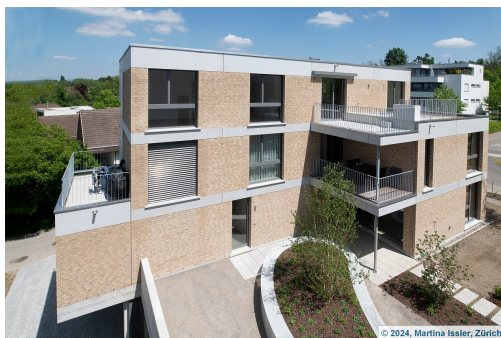
Ansicht West Haus A