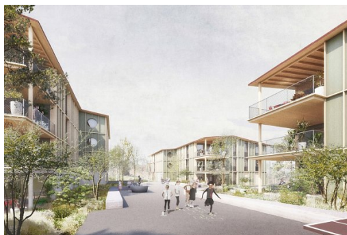
Projekt der Diagonal Architekten AG + Brogle Rüeger Landschaftsarchitekten