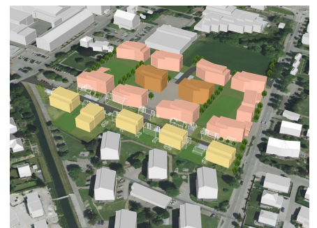
Visualisierung Variantenstudium 3