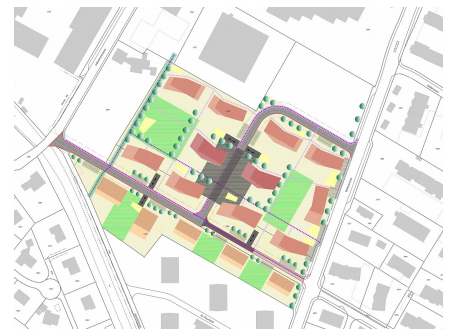
Plandarstellung Variantenstudium 3