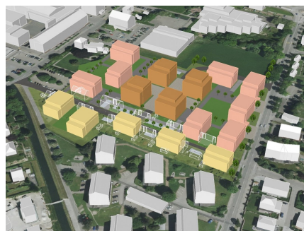
Visualisierung Variantenstudium 2