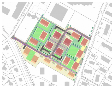
Plandarstellung Variantenstudium 2