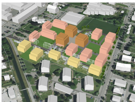
Visualisierung Variantenstudium 1