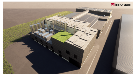
Visualisierung Draufsicht von Norden