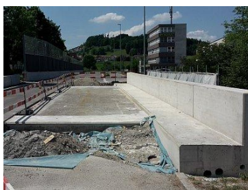
Erweiterung Murgbrücke Spangenhofen