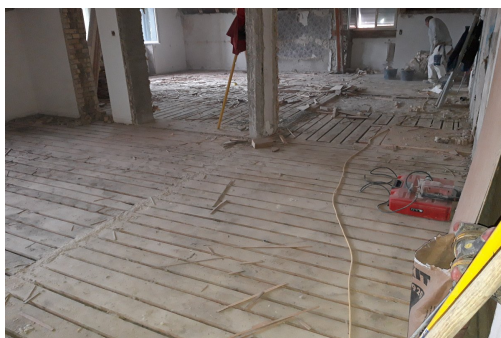
Ertüchtigung Holzbalkendecke mit Bretterboden

Projektbeschreibung Beim denkmalgeschützten Schulhaus (Baujahr 1901) wurden diverse bauliche Massnahmen umgesetzt, um den heutigen Schulraumanforderungen und den Sicherheitsnormen, beispielsweise Erdbeben- und Brandschutzertüchtigung sowie hindernisfreie Erschliessung, gerecht zu werden. Unter anderem mussten diverse Tragelemente aus Stahl verkleidet und Holzbalkendecken mit Bretterboden ertüchtigt werden, um die Anforderungen Brandschutz zu erfüllen. Das Zusammenspiel von Denkmal- und Brandschutz war eine zentrale Aufgabe bei diesem Projekt.