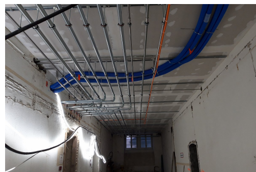
Technische Installationen UG