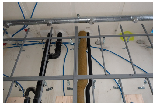
Sanitärleitungen durch Brandabschnitt