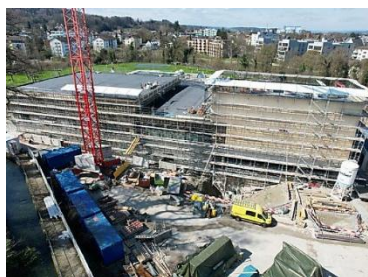
Neubau Hallenbad Frauenfeld

Weitere Informationen findest du unter: www.bhateam.ch